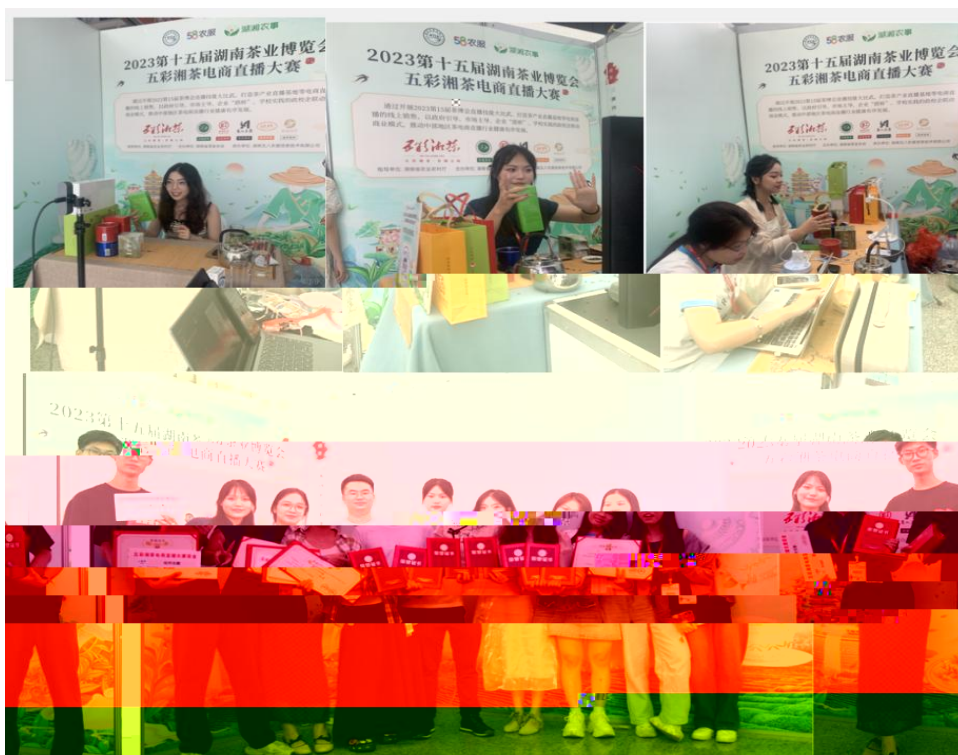
图 “湖南省第十五届茶博会” 电商直播比赛现场

播和方的，短 得的步。 队比 10多单、单， 包但不、等多个，的 和队得的高度。的 得不对公的，更对参 付出和的充分定。