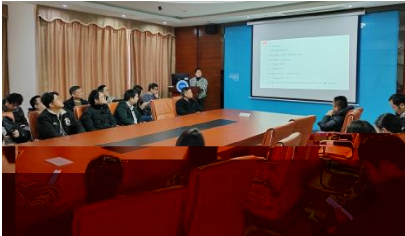
图 员工专业技能培训

2023 年，公司 促 进 发 展 和 才 方 得 成 功。 通 过 创 新 的 和 策 略， 不 断 动 公 司 的 持 续 成 长， 工 供 应 的 发 展 机 会。 通 过 供 多 样 化 的 和 发 展， “ 队 伍 共 建 ” 等 活 动 ( 4-5)， 帮 助 工 人 技 术 和 管 理； 并 通 过 的 和 规 划， 工 人 的 合 作 和 包 围， 导 发 展 计 划、 技 术 技 术 及 部 等， 地 促 进 工 人 的 方 发 展。