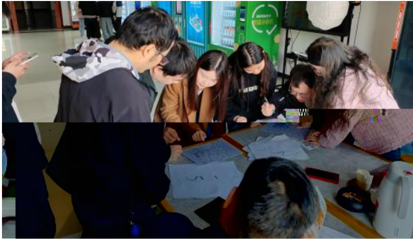
图 卓越团队建设共识营